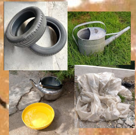
Contenitori di vario tipo

Controlliamo che siano al riparo dalla pioggia